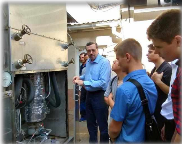
Навчальні заняття здобувачів освіти ОТФК в лабораторіях ННІ холоду, кріотехнологій та екоенергетики ім. В.С. Мартиновського ОНАХТ