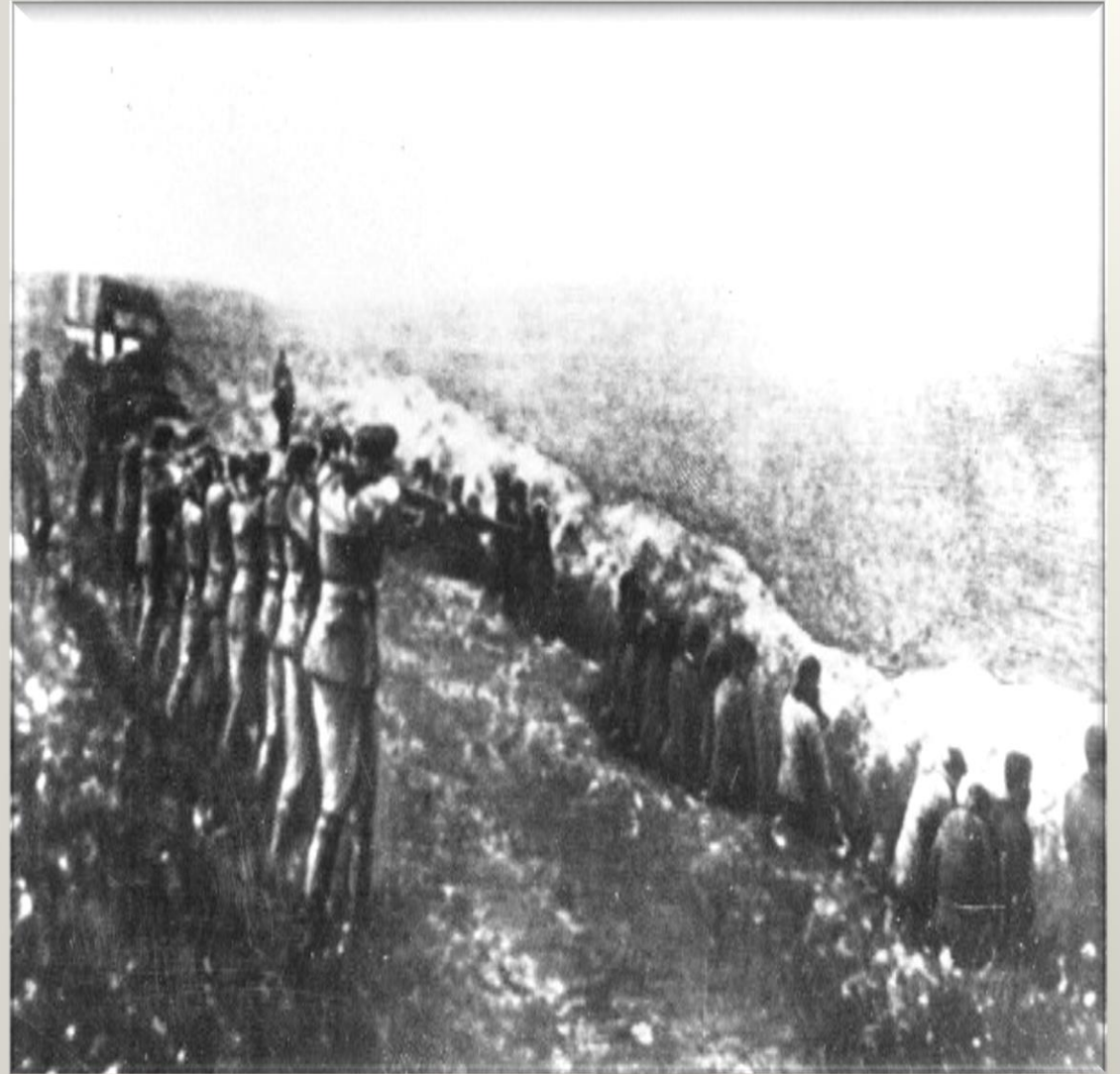
Бабин Яр, конвеєр смерті

Так само неприпустимими є спроби прикриватися моральним авторитетом переможця для агресивної політики, кульмінацією якої стало злочинне повномасштабне вторгнення Російської Федерації в Україну 24 лютого 2022 року.