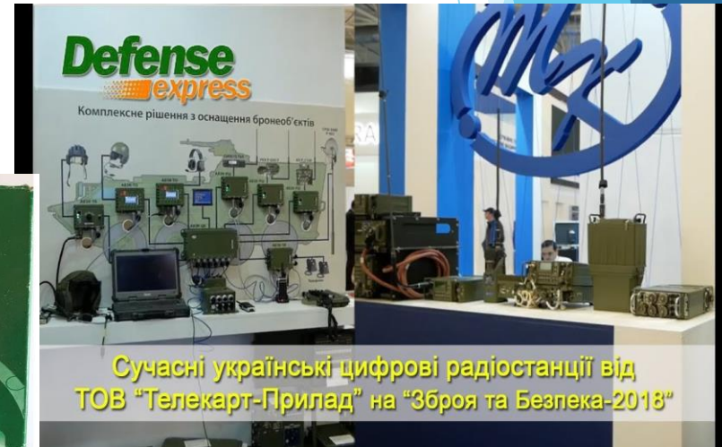
Сучасні українські цифрові радіостанції від ТОВ "Телекарт-Прилад" на "Зброя та Безпека-2018"