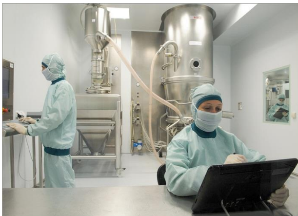
ТДВ Інтерхім (ліки)