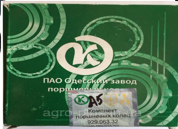
Завод поршневих колець