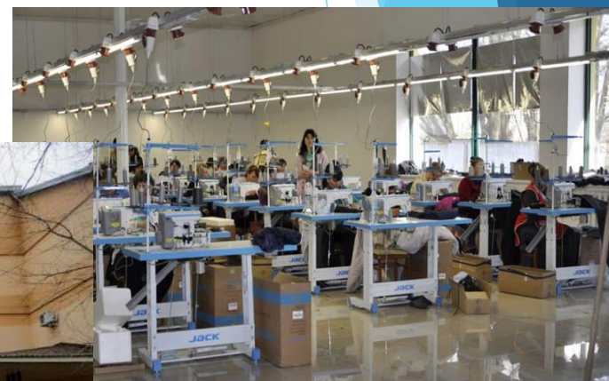
Болградський р-н: У селі Василівці інвестор з Німеччини відкрив сучасний швейний цех- Бессарабія