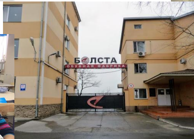
Обувна фабрика <Белста>> Білгород-Дністровський