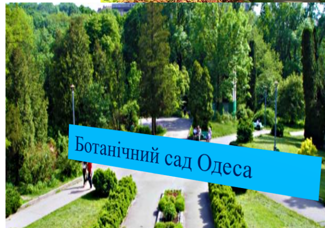
Ботанічний сад Одеса