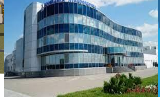
Одеський олійножировий комбінат, ПАТ