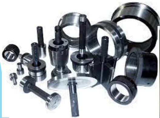
ТОВ ХК Мікрон

Промисловість Одеської області відіграє значну роль в структурі народногосподарського комплексу України та південного економічного району. На території області розташовані підприємства з виробництва продуктів нафтопереробки, машинобудування, ремонту та монтажу машин, металургії та оброблення металу, хімічної і нафтохімічної, харчової, легкої промисловості.