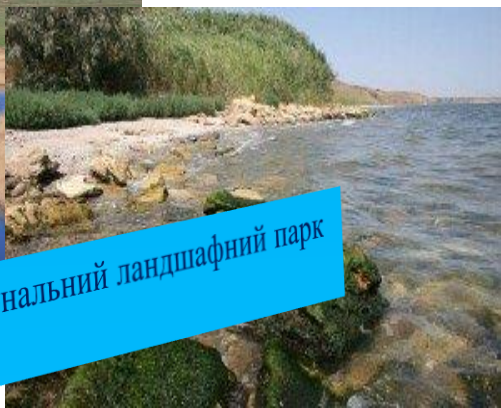
Тилігульський регіональний ландшафтний парк у Коблево