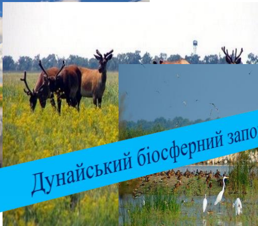
Дунайський біосферний заповідник