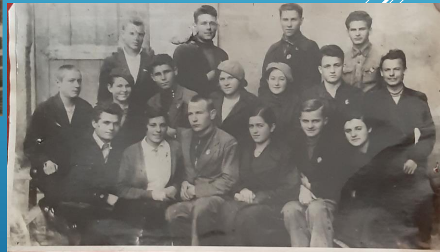
Випуск 1941 р.