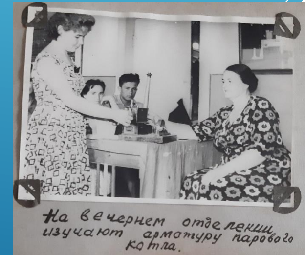
На вечернем отделении изучают арматуру парового котла.