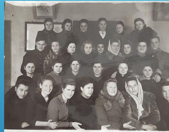
Випуск 1947 р.