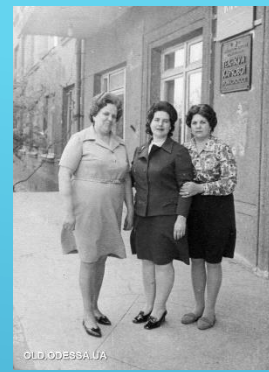
Студентки заочного відділення 1970 років