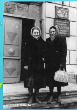
Студентки 1950 років

У 1962р. випуском останньої групи тютюників це відділення припинило своє існування, а на вечірнім відділенні в цьому ж році почалася підготовка механіків цукрової промисловості.