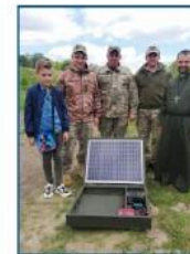
Остан, 10 р. на свої заощадження купив потативний зарядний пристрій