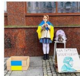
Соломія Реут, 6 р. збирає гроші, граючи на флейті