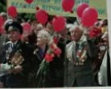
З семи мільйонів євреїв та мільйонів інших були відібрані радські воїни, кожна третя награда врятувала українців.

Вони боролися до останнього дихання. Вони не дали ні кроку території України в руки ворогові. Вони врятували країну. Вони врятували Європу. Вони врятували світ.